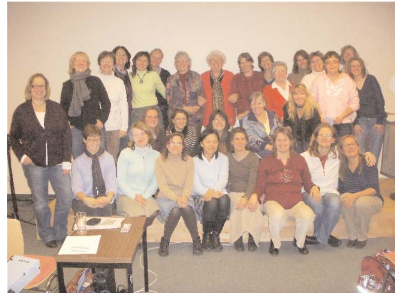
Frauentag am 1.11.2008